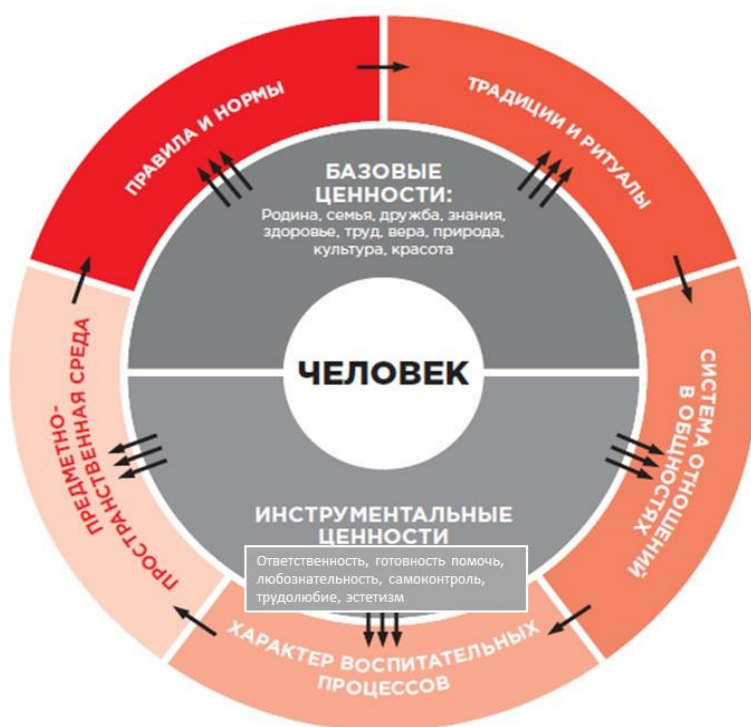
Рис. 1 Модель уклада Образовательной организации